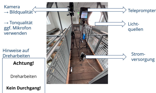
Fig. 7: Test run of the technology.

Fig. 7 gives an impression of such a turning set.