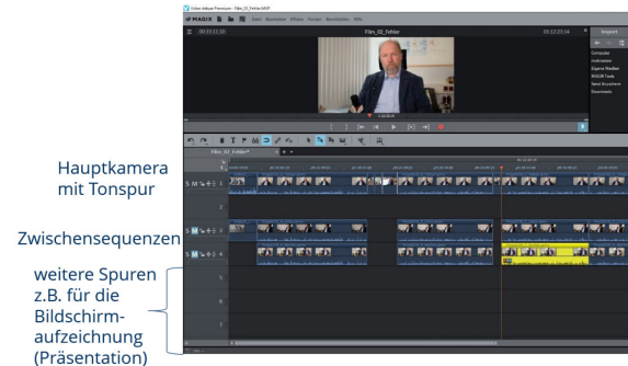
Fig. 8: Matrix.

Once all the image and sound data has been collected and saved, the individual scenes can be merged. Different camera angles, close-ups and long-distance shots, scene transitions and synchronization of the soundtrack play a decisive role here. Various software programs such as Matrix (Fig. 8) offer support here.