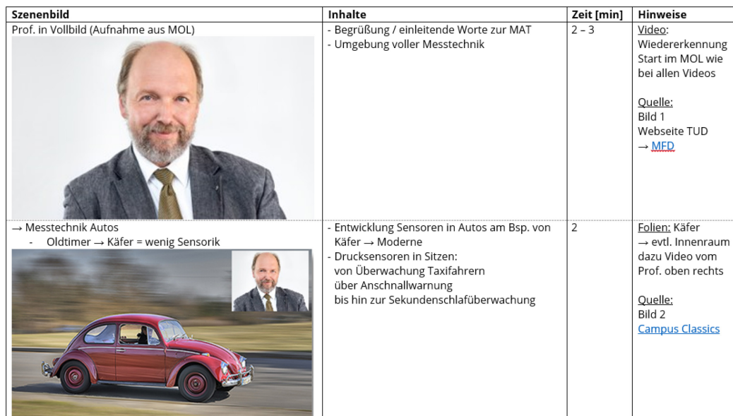
Fig. 3: Example of a storyboard.

It was implemented in the form of storyboards, which for example document the set design,